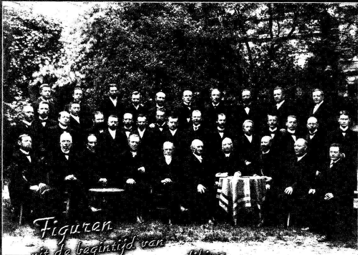
Figuren uit de begintijd van de kohlbruggiaanse prediking