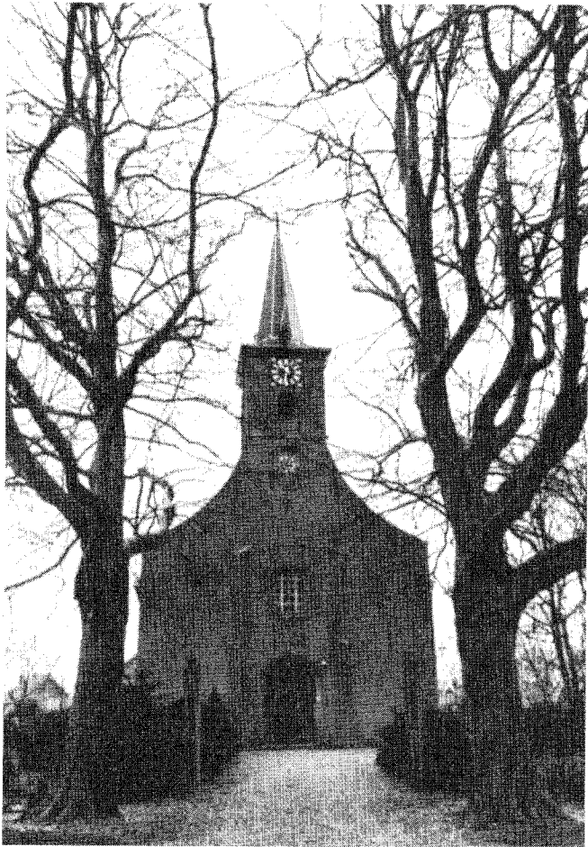
De Hervormde Kerk van Nieuw-Beijerland, waaromheen de dodenakker (thans zijn nog slechts enkele graven aanwezig).