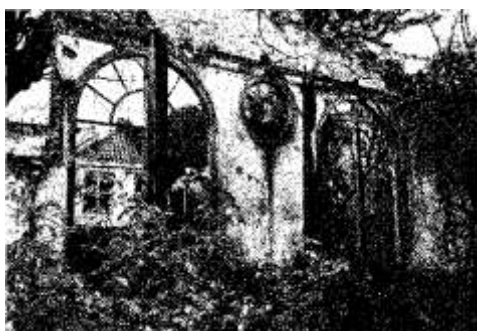
Ruïne van de synagoge op een terreintje achter de Herenstraat te Middelburg.