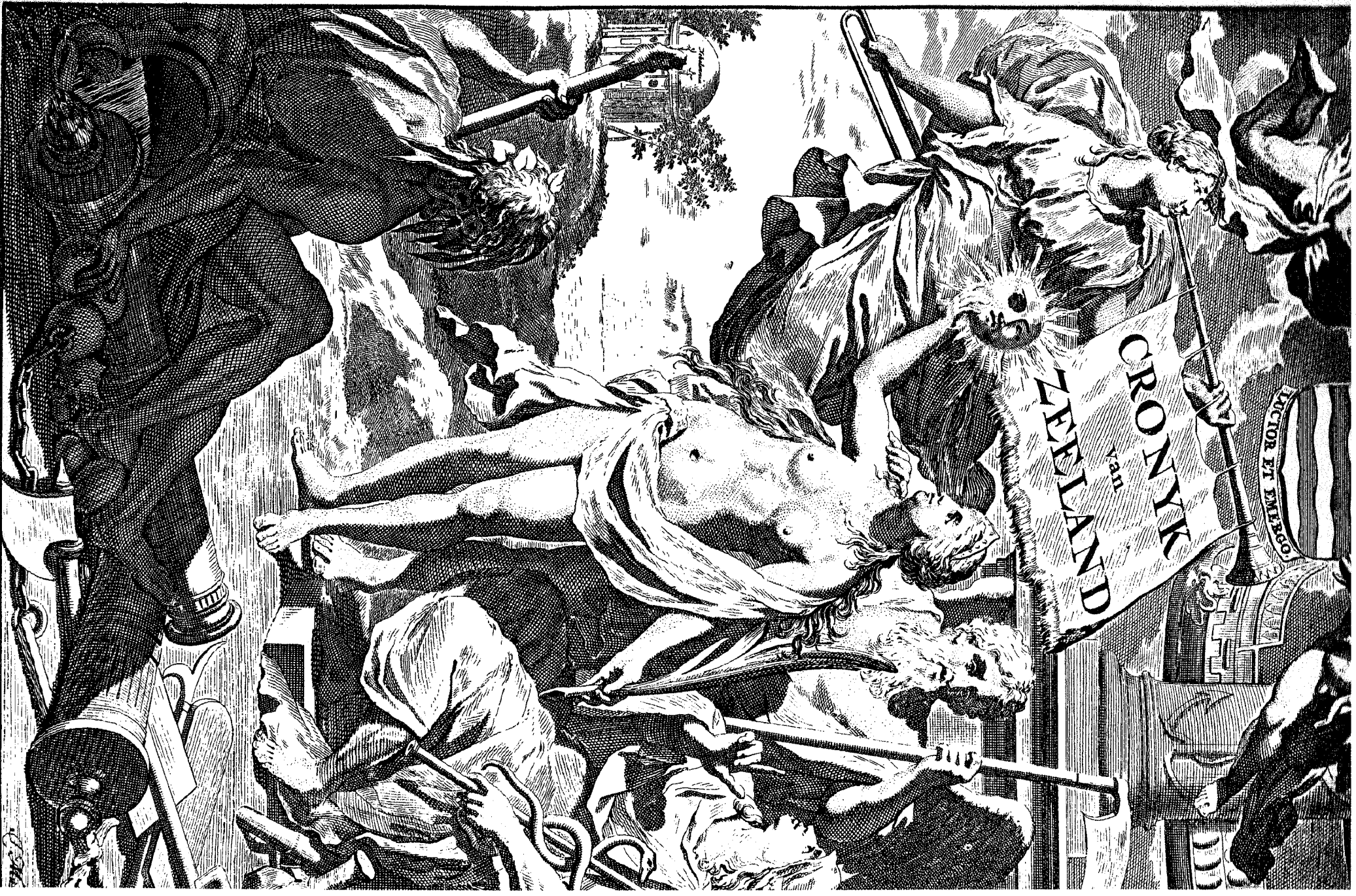
Tot Middelburg Gedrukt by IOHANNES MERTENS, Ordinarius Stads-Druc.