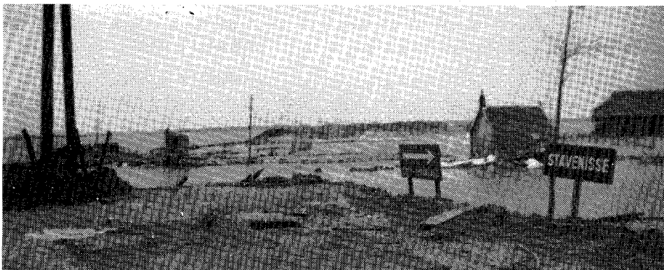
Overzicht van de dijkdoorbraken te Stavenisse op 1 februari 1953.