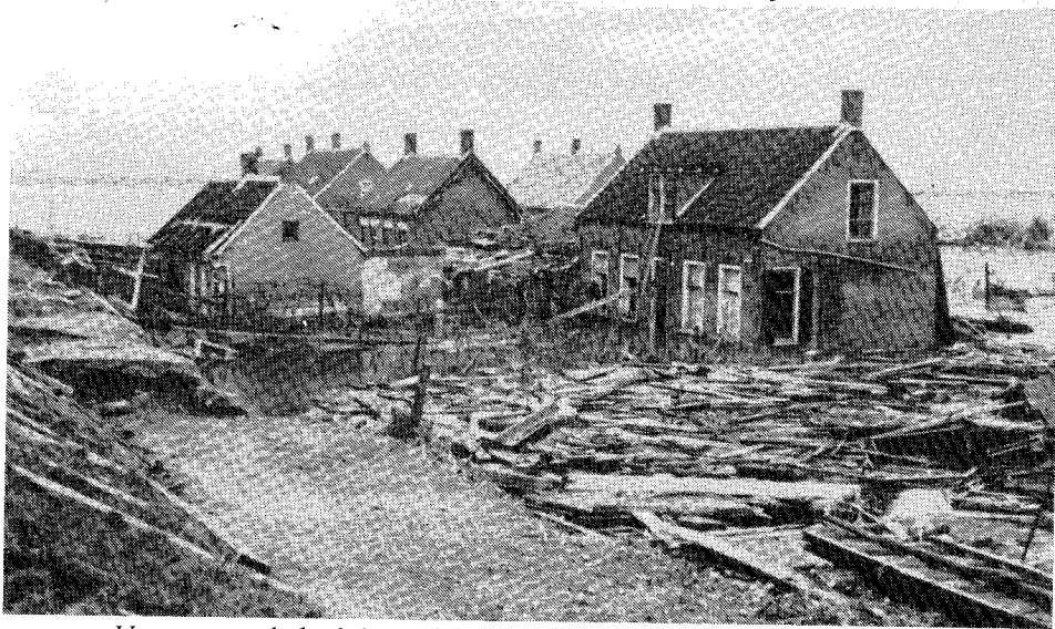
Veerweg, met links de havendijk, waar de eerste doorbraak naar de Margarethapolder plaatsvond.