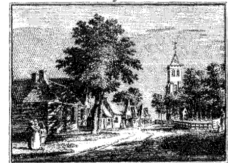
Het oude Meliskerke