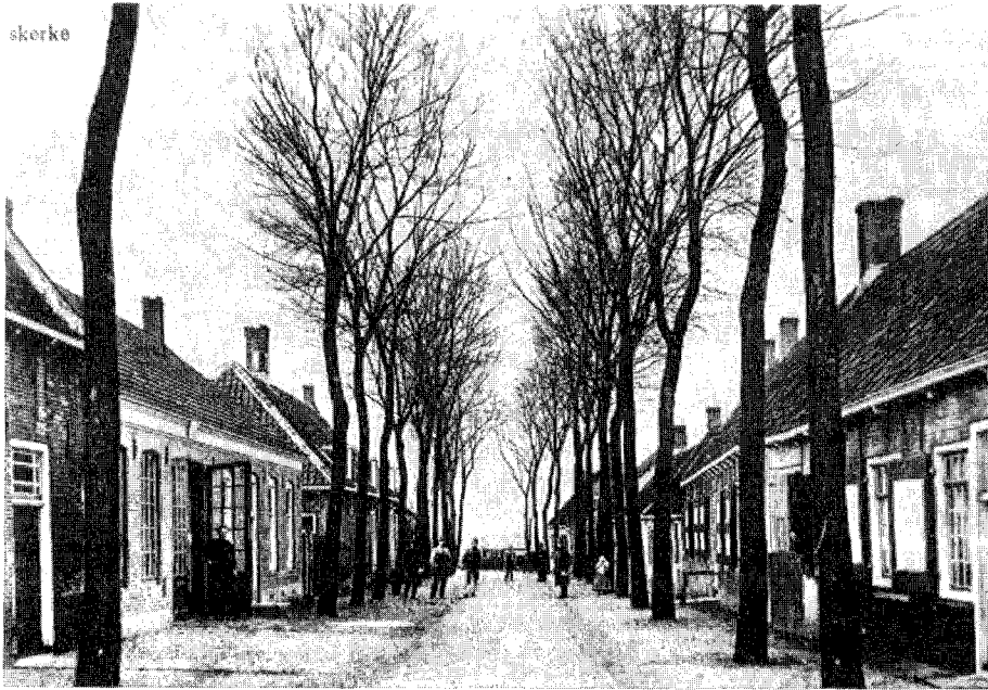
Het Noordeinde in Meliskerke, links met open deur de smederij, daartegenover de wagenmakerij.

niet. Ook bij het vrouwenkostuum behoorde goud, en ook hiertegen werd wel bezwaar gemaakt. Men sprak dan van 'vrouwen omhangen met werlds goud'. Jan Vader heeft altijd het Walcherse kostuum gedragen, ook toen hij later het land doortrok om te preken.