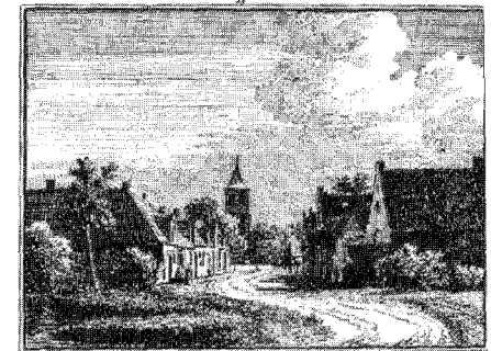
Het DORP MELISKERKE. 1748.