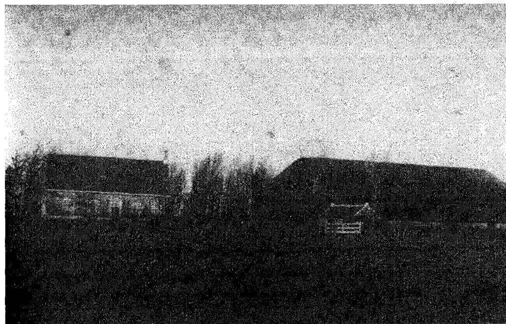
De hofstede Houtenburg

Taalkundig is er wel wat op de teksten aan te merken. We moeten beseffen dat ze geschreven zijn door iemand die weinig onderwijs had genoten en die het Walcherse dialect sprak, waarin de letters 'G' en 'H' vaak worden verwisseld. Ook de tijdgeest is merkbaar: deugdzaam leven, normen en waarden hoog houden. Die tijdgeest heeft hem niet van de rechte weg afgebracht. Integendeel. Hij kreeg sympathie voor degenen die de Hervormde Kerk hadden moeten verlaten, vanwege het vasthouden aan de aloude Gereformeerde prediking, en die hun toevlucht hadden gezocht in de afgescheiden kerken. De afzetting van predikanten bedroefde hem zeer.