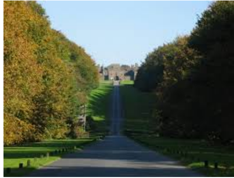
Bossen bij Houghton Towers: