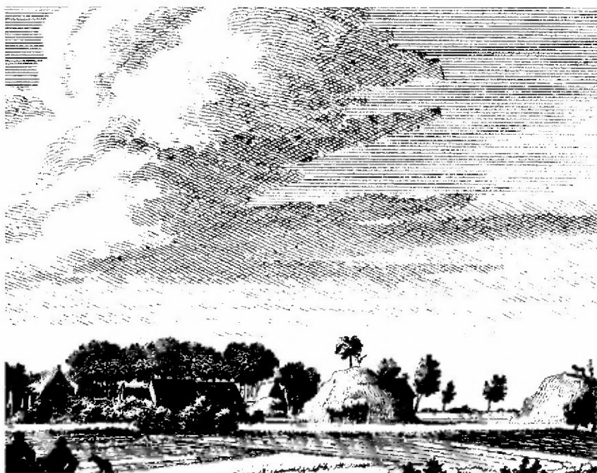
De heerlijkheid Mariekerke – 1945.

kerken op Walcheren. De Geuzen gingen niet zachtzinnig om met Roomse Kerken. Een algehele restauratie had plaats rond 1650. Toen werd het koor aan de oostzijde afgebroken en de zuidelijke zijbeuk met het schip tot één kerkruimte omgebouwd. Kenmerk van de Reformatie was de eenvoud in de kerkgebouwen terug te brengen en functionele ruimten te scheppen voor de Woordverkondiging. De prediking stond centraal! Boven de kerkingang is nog een nis te zien waarin een beeld gestaan zal hebben van Maria of Sint Odulphus. Op de plaats van het koor werd een consistorie gebouwd. Bij de restauratie van de kerk in 1958 vond men een Romaanse grafzerk uit de 12e of 13e eeuw, een halve meter onder de grond even buiten de zuidmuur. Dit kan er op duiden dat op dezelfde plaats reeds eerder een kerk stond. Ook in Mariekerke (tegenwoordig Klein Mariekerke) heeft een kerk gestaan, deze werd gebouwd in 1189. Tirion beschrijft Mariekerke in 1571 als een dorp met weinig huizen en een vervallen kerk. Dus zal er toen al niet veel van de kerk over geweest zijn. De Hervormden zullen van deze kerk geen gebruik meer hebben gemaakt. Zoals de