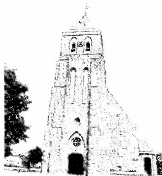
De nis boven de torendeur.