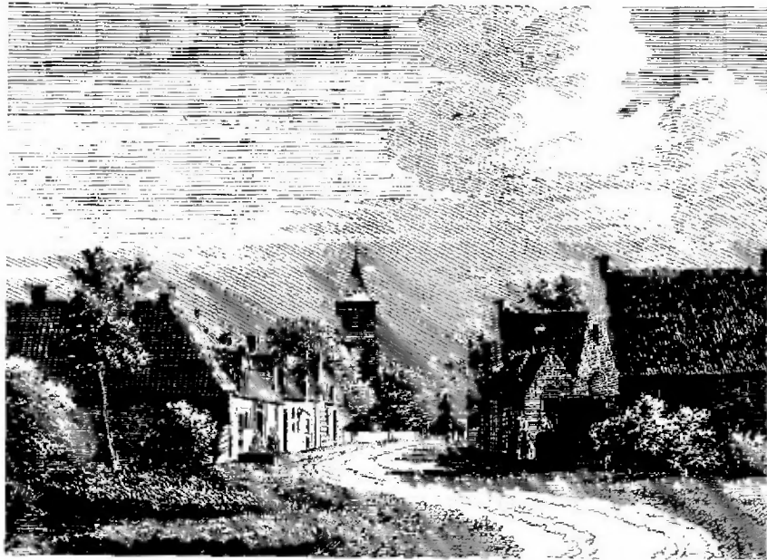
Meliskerke - 1745.