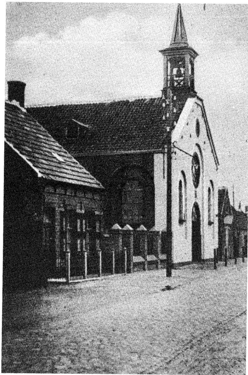
Het kerkgebouw zoals dat er ongeveer 60 jaar geleden uitzag.