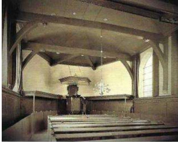
De kansel van de Hervormde kerk

Dit maakte mij werkzaam en uit de benauwdheid moest ik uitroepen en zuchten tot de Heere. Die betoonde Zich geen land van uiterste duisternis te zijn. Toen kwam de Heere op Zijn tijd van vrede te spreken. Ik wilde maar geloven in eigen kracht, maar zonder bediening van de Geest is het geloof als dood. De Heere kwam tot onderwijzing met deze waarheid in mijn hart, met de woorden die Hij tot Thomas sprak: "Gij gelooft omdat gij gezien hebt, maar zalig zijn zij die geloven en niet gezien hebben." Dat ging met zoveel kracht gepaard, dat ik uitriep: "En dat aan zo een als ik ben, want ik gevoelde mij niet waardig dat Hij onder mijn dak zou inkomen". Hij besloot dit gedeelte als volgt: 'Zo heeft de Heere mij altijd willen leiden en mij laag bij de grond gehouden. Ik heb mogen leren dat een mens zonder tekenen van Zijn trouw en beoefening in het leven van genade, de weg naar Sion niet kan gaan. Al had hij het geloof dat hij bergen kon verzetten en hij moest de kracht van het zalige geloof missen, dan was hij nog niets.'