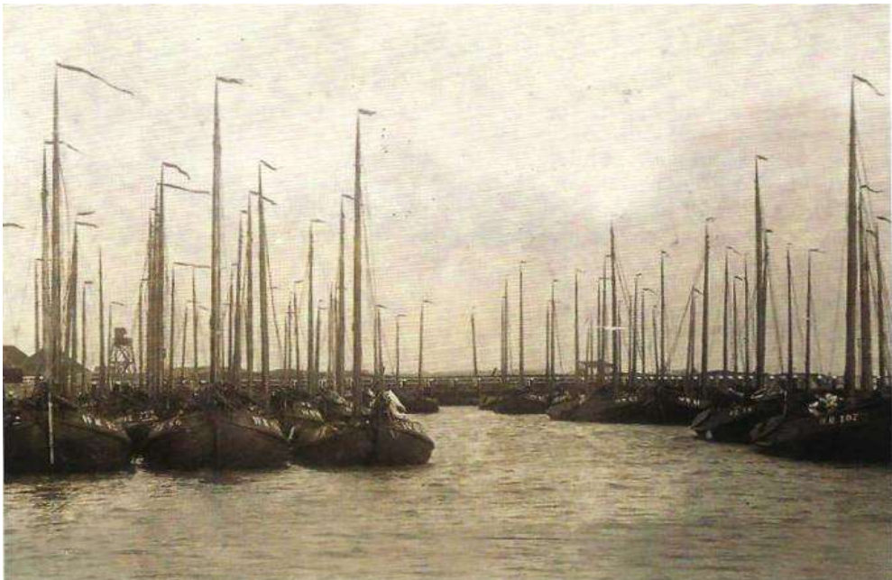
Vissersboten op de Schelde

En stap ik dan aan wal, 'k zal Hem dan eeuwig eren, Die door Zijn wijs beleid m' een veil'ge weg wou leren. Die mij door liefd' en trouw ten haven heeft geleid. Hem zij de roem, de dank, tot in al de eeuwigheid.