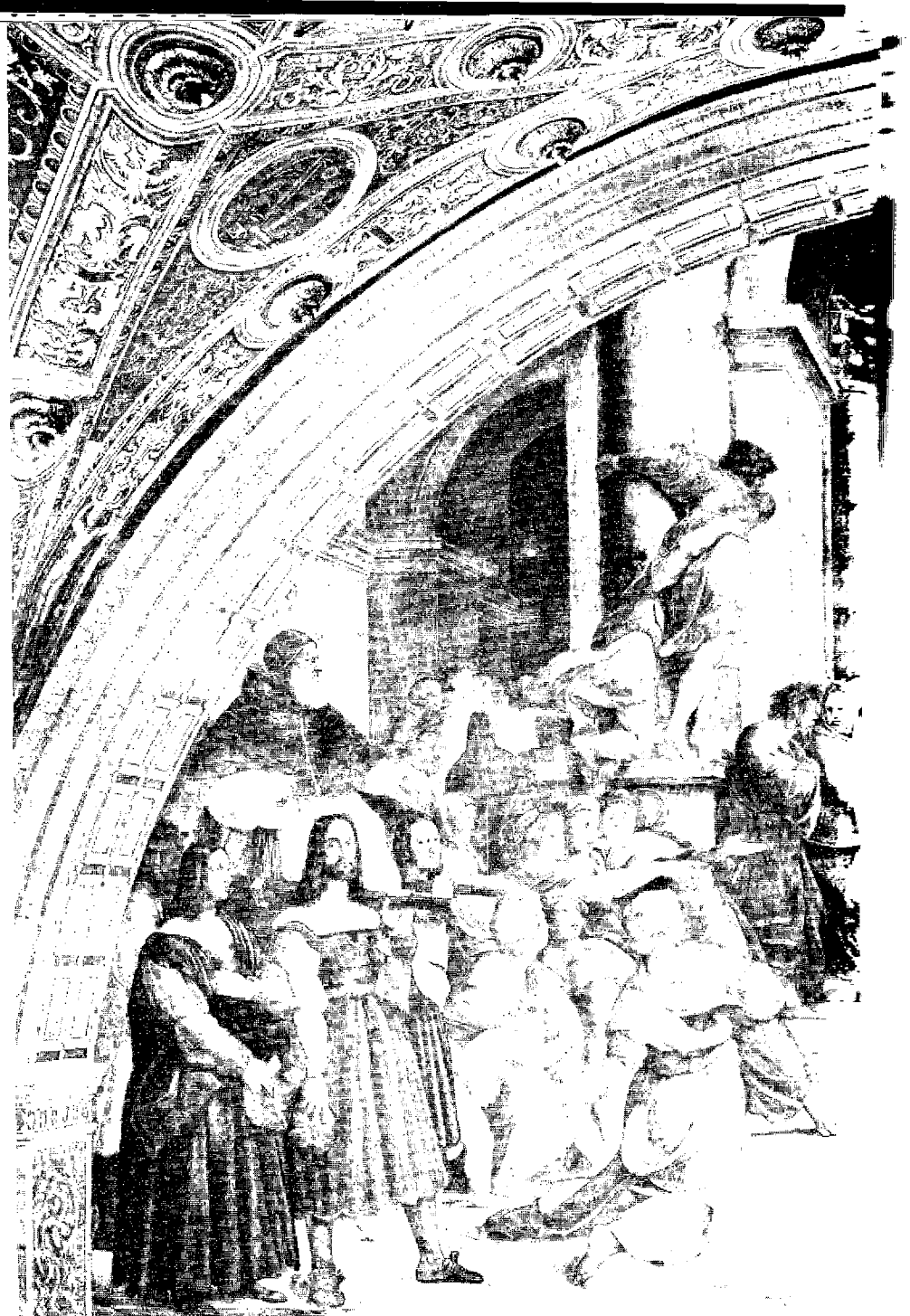
Rafaels schildering, nu in de 'Heliodorus Kamer' in het Vaticaan, van de mislukte poging der Seleucidische minister Heliodorus, om zich meester te maken van de schatten der tempel in Jeruzalem. Let op de menorah aan de rechterkant van het gewelfde portaal

dat Simon 'een aanklacht had ingediend' bij het Syrische bestuursapparaat, behelsend dat Onias pro-Egyptisch was gezind; voorts dat hij in de schatkamer van de tempel 'onnoemelijk veel rijkdommen' had verborgen — 'de som van opeenghoopte saldo's was inderdaad niet te berekenen en ... hij stelde voor dat deze saldo's onder beheer van de koning zouden komen' (II Makkabeeën 3 : 6).