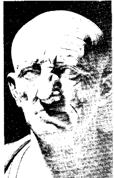
Een Romeinse patriciër, mogelijk een lid van dezelfde senaat die de Seleucidische vorst het ultimatum stelde

Polybius vervolgt: 'De koning was stomverbaasd over dit autoritaire optreden maar na enige ogenblikken gearzeld te hebben, zei hij alles te doen wat de