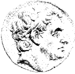
boven Seleucus I op een zilveren tetradrachme onder Ptolemeus I op een zilveren diobool, geslagen in Alexandrië