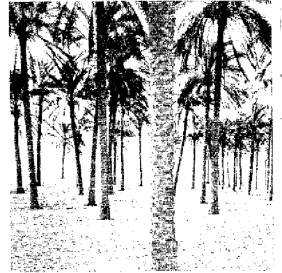
De palmen van El Arisj aan de 'Zeeweg' uit de oudheid. Antiochus volgde deze weg toen hij door Rome werd gedwongen zijn Egyptische campagne op te geven

Tussen Syrië in het noorden en Egypte in het zuiden lag Palestina en om strategische redenen werd het door beiden, Ptolemeus en Seleucus, begeerd. Hoewel Ptolemeus het aan Seleucus had beloofd wegens onmisbare militaire hulp tegen een derde generaal van Alexander, lijfde hij Palestina bij zijn eigen rijk in en gedurende de volgende honderd jaar (uitgezonderd een paar korte