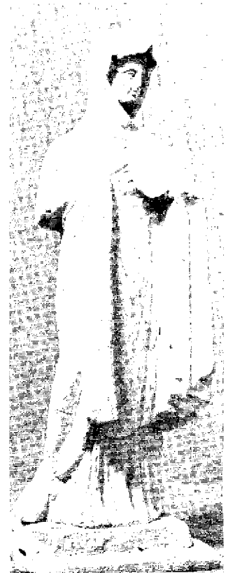
Een modieuze Griekse dame uit de derde eeuw v.Chr.

Sommige onderdelen van dit verhaal van Josephus worden door moderne geleerden in twijfel getrokken. Het is echter waar dat Jozef een zoon had die Hyrcanus heette; hij was de jongste en de lieveling van zijn vader en werd door zijn broers gehaat. Deze haat ging over op hun nageslacht. Het is ook waar dat Hyrcanus Jozefs rol – en gunsten – aan Ptolemeus' hof erfde, en dit feit kan zijn broers binnen het pro-Seleucidische kamp hebben gebracht. Deze politieke verschillen werden ook overgenomen door hun nakomelingen. Hyrcanus verloor, toen de Seleuciden onder Antiochus III controle over Palestina kregen. Hij vluchtte naar Transjordanië en men vermoedt dat hij enige jaren later zelfmoord pleegde. Vanaf dat moment waren de families van zijn broers – de overblijvende 'Zonen van Tobias' – degenen die door het koninklijk huis, nu het Seleucidische hof in Antiochië, werden begunstigd.