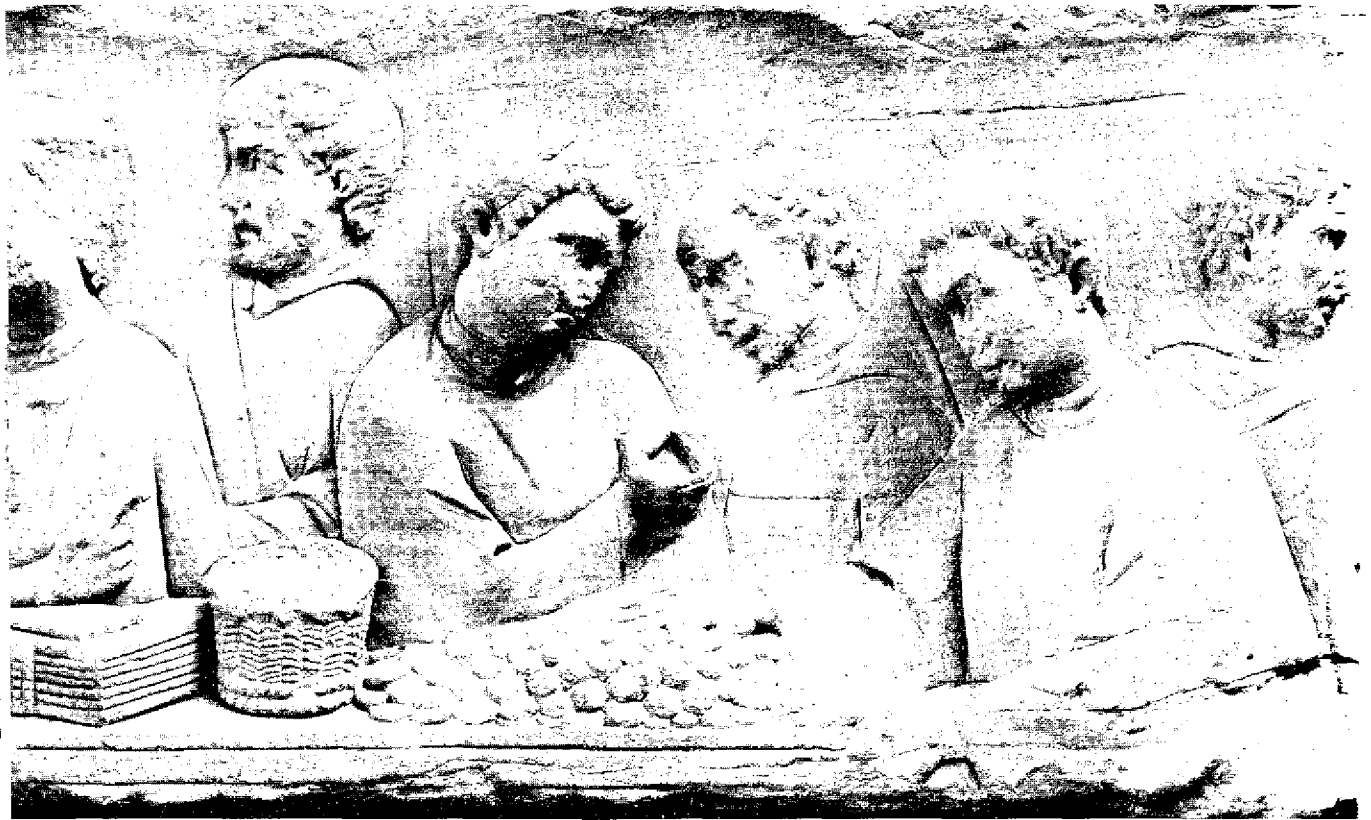
Romeins reliëf: boeren die hun belastingverplichtingen voldoen

gehuwd en vader van zeven kinderen — vergezeld werd door zijn broer Solymius die was gekomen om in de Alexandrijnse gemeenschap 'een jood van stand te vinden' die 'geschikt was om zijn dochter te huwen' (die ook bij hen was). Na aankomst in de hoofdstad liet Jozef hen achter en ging naar een banket in het paleis, waar hij verliefd werd op een meisje dat danste om de koning te verstrooien. Nadat hij zijn geheim aan zijn broer had toevertrouwd vroeg hij hem ervoor te zorgen dat hij en het meisje elkaar in het geheim zouden kunnen ontmoeten, omdat hij haar niet wettig kon huwen. Solymius was ontsteld, maar hij zag in dat er op dat moment met Jozef niet viel te praten.