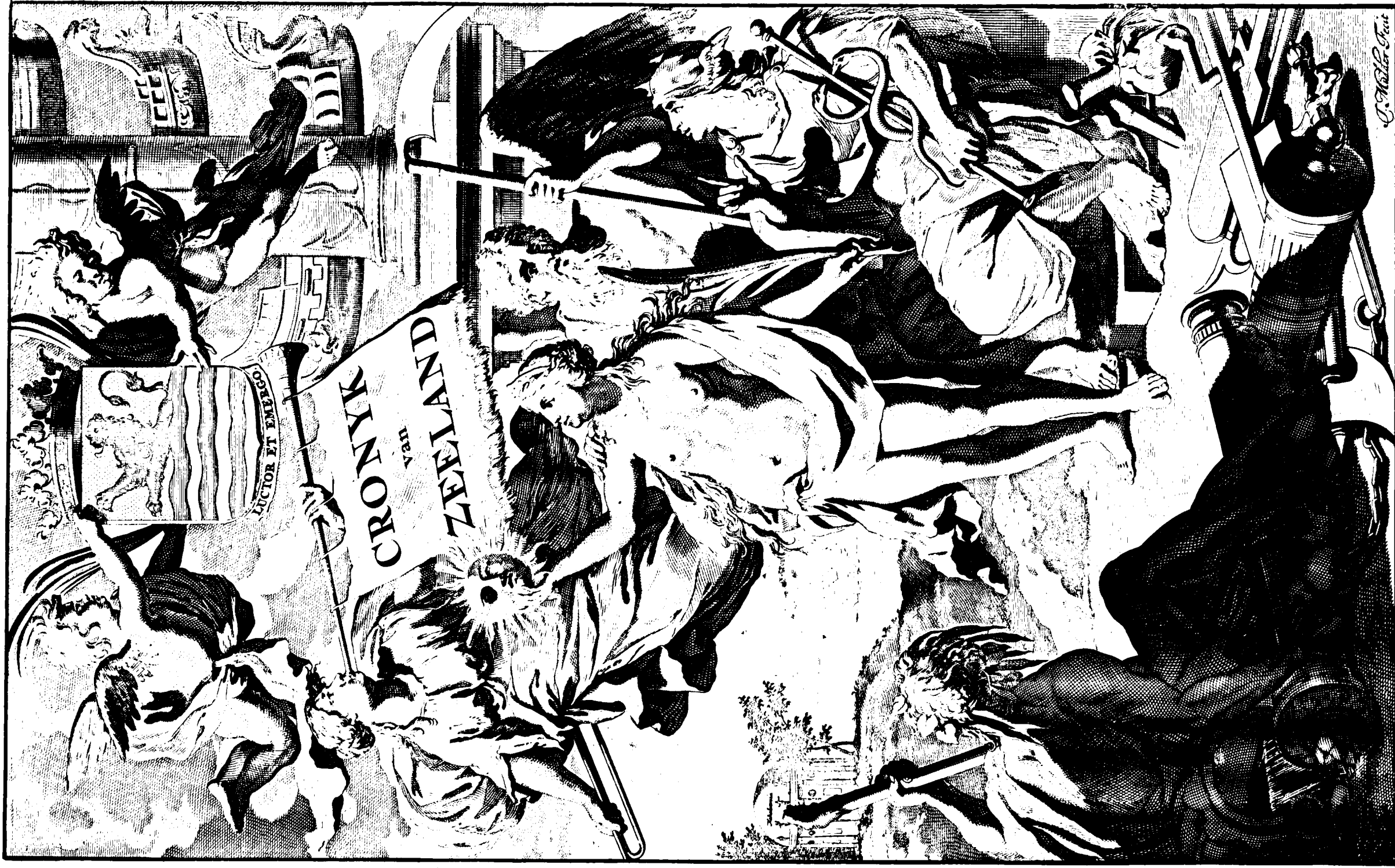
Tot Middelburg Gedrukt by IOHANNES MEERTENS, Ordinarius Stads-Drucker 1696.