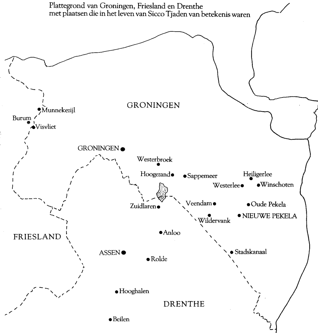
Plattegrond van Groningen, Friesland en Drenthe met plaatsen die in het leven van Sicco Tjaden van betekenis waren