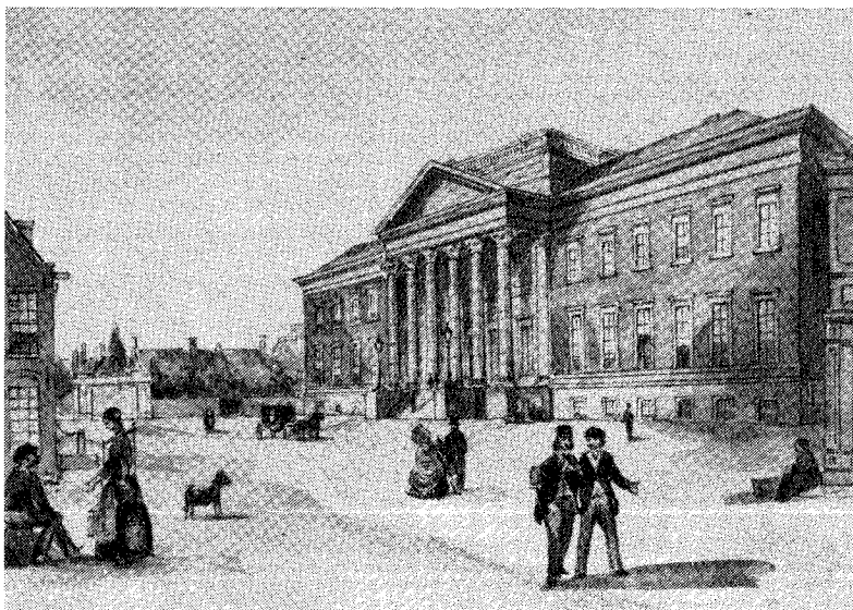
De academie te Groningen.