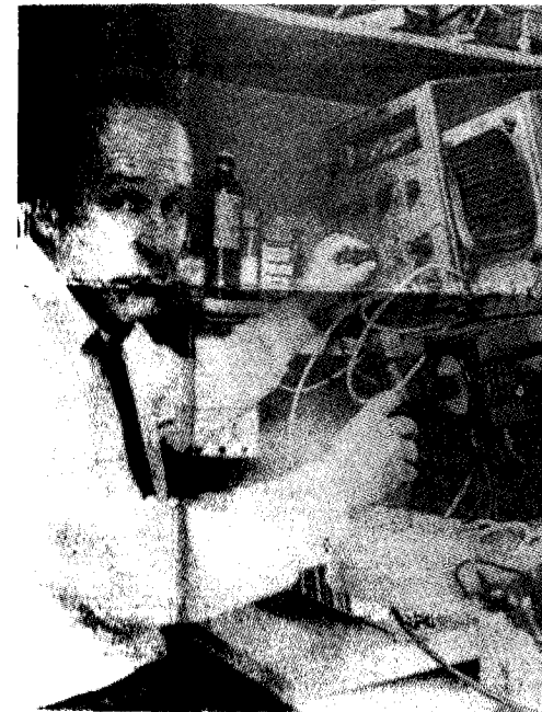
We verbraken het zegel en ik begon het toestel in te schakelen.

"We verbraken het zegel, ik schakelde het toestel aan en begon het in te stellen. Dat was voor mij gesneden koek. Maar het was op dat moment wel clandestien. Ik dacht: ik ga me melden bij Den Haag, want ik hoorde