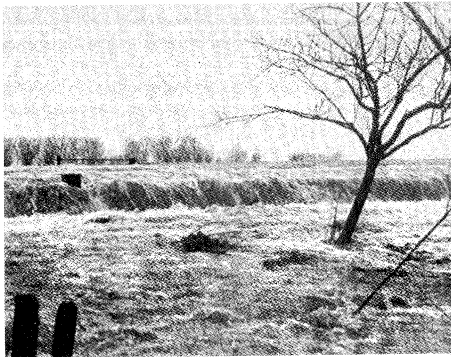
"Er is nood!"

ervaring op en leerde dwars door storingen heen de uitgezonden signalen herkennen. Nooit kon ik toen vermoeden hoe mij dat, tijdens de ramp, zo ontzettend van pas zou komen. Dat zie ik als iets wonderlijks... Iets van een hogere leiding in je leven!..."