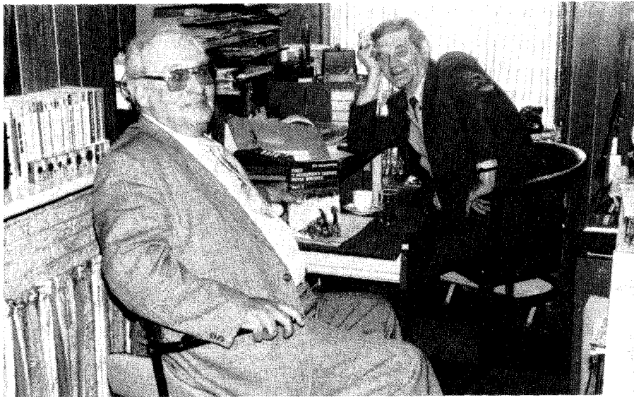
De gezochte 'May Be-piraat' bij mij op kantoor.