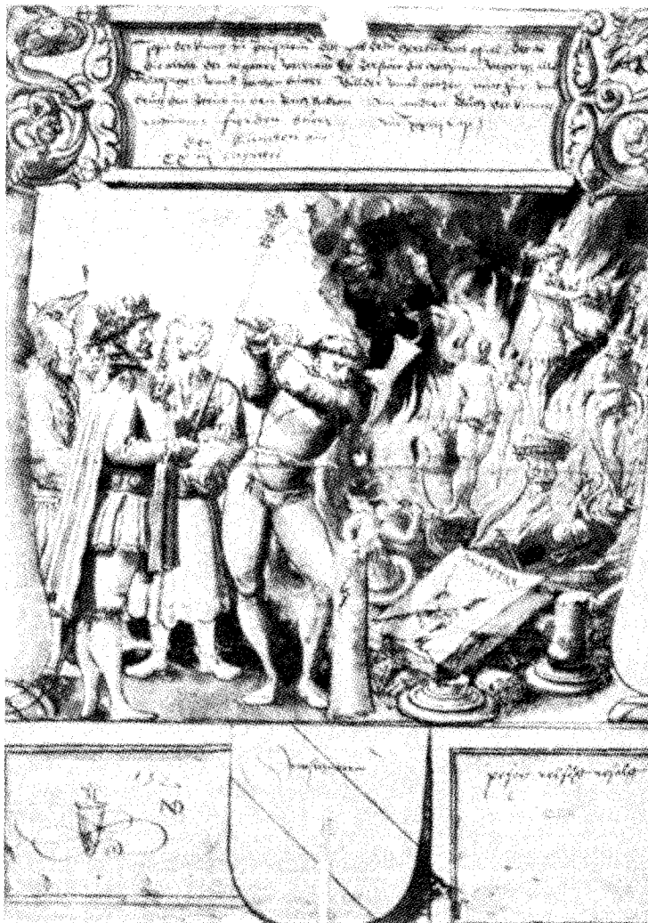
Koning Josia laat de afgodsbeelden verwoesten, door Niklaus Manuel Deutsch, Bern 1527.

den viel het de bezetters op dat de joodse godsdienst beeldloos was. Toen Pompejus in het jaar 63 v.C. de hoofdstad Jeruzalem veroverde, en daarbij de tempel binnendrong, verbaasde het hem dat zich daar geen enkel beeld van Jahwe bevond. De Romeinse geschiedschrijver Tacitus schreef er het volgende over: 'Van toen af werd het ruchtbaar, dat zich daarbinnen geen enkel godenbeeld bevond, en dat het een onbezette plaats was, een ledig geheim.' 2