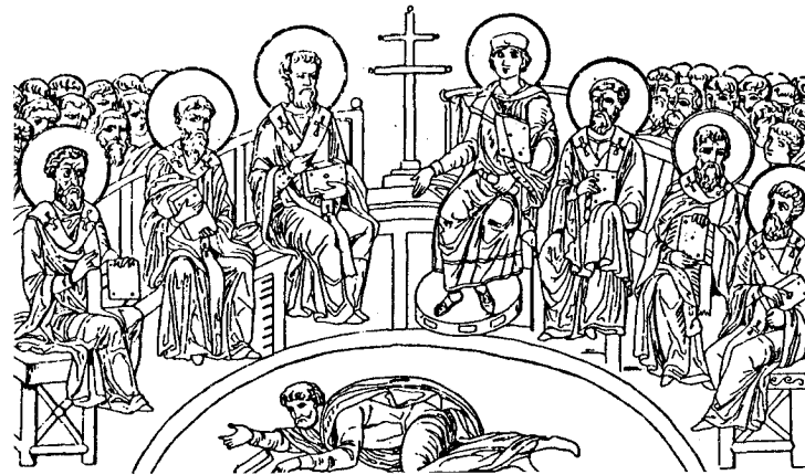
Op het tweede concilie van Nicea (787) werd de beeldenverering aan de kerken voorgeschreven; hier laat een beeldenstormer zijn geschrift vallen en smeekt de kerkvergadering om genade, die hem onmiddellijk wordt verleend.

Het genoemde concilie van Nicea had echter de kerk in het westen, dus in het Frankische rijk van Karel de Grote, níet betrokken bij zijn beraadslagingen en beslissingen. Mee daarom veroordeelde Karel de Grote het besluit van Nicea. 6 De synode van Frankfurt in 794 nam een soortgelijke houding aan. Toch waren