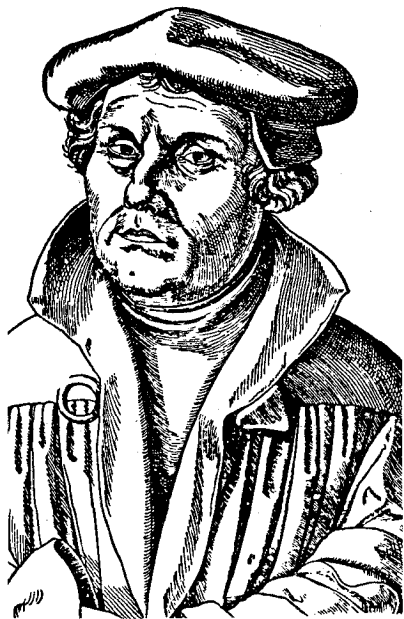
Maarten Luther (1483-1546), door Hans Brosamer.

De laat-middeleeuwse gelovige werd bijna bedolven onder een