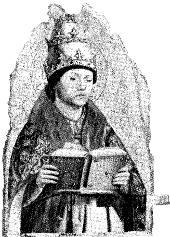
Paus Gregorius de Grote (590-604), beelden als 'boeken der leken'.

Toch heeft de stem van protest en kritiek nooit gezwegen. In elke kerkelijke 'oppositie-beweging' van de middeleeuwen klinkt de kritiek op de beeldenverering duidelijk mee. 7 De krachtigste protesten komen van Bernard van Clairvaux, de Waldenzen, John Wycliff, Johannes Hus en hun volgelingen.