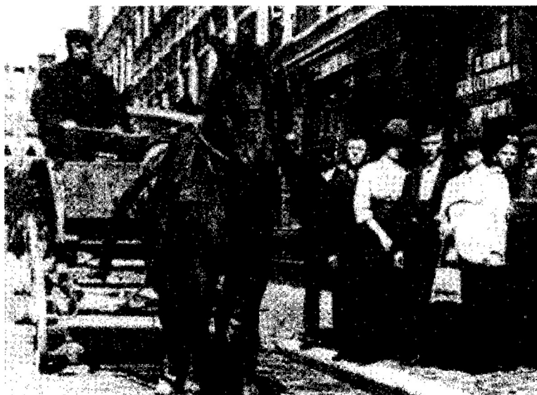
Exterieur gebouw Elim aan de Tulpstraat, ca. 1900

'In de jaren dat ik met ds. Adler werkte, heb ik vaak zijn eenvoud en zachtmoedigheid, zijn tact en zijn grote gaven bewonderd. Gods Woord was voor hem onuitputtelijk. Op een zendingsreis, die ik met hem deed in het noordelijk gedeelte