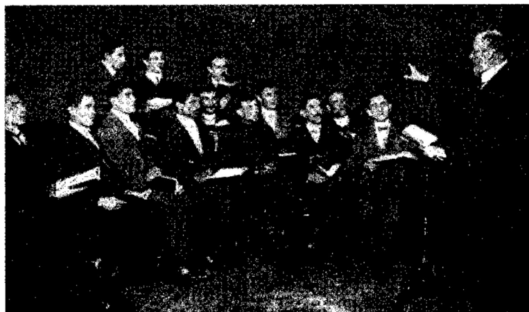
Joodse emigranten, luisterend naar het Evangelie

Vader was in Rotterdam onder de Joden begonnen met straatprediking. Hij deed dit, omdat het op dat ogenblik de enige methode was. Wanneer de belangstelling gewekt was en men toe was aan een rustig persoonlijk gesprek kon dit in de woonkamer plaatsvinden.