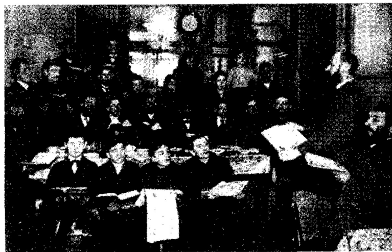
Joden, luisterend naar en meelezend in het Nieuwe Testament

Om in deze toestand verbetering te brengen, ben ik al tweeëntwintig jaar biddend. Mijn gebed werd aanvankelijk verhoord ongeveer negen jaar geleden in 1902. Ik begon toen met twee Joden aan een tafeltje in Elim sigaretten te maken. Geen van ons was vakman en dus was er ook geen van ons baas. Wij moesten het elkaar leren. Ook dit mosterdzaadje begon te groeien en werd een boom. Wel heb ik veel onaangenaams over deze werkverschaffing moeten horen, namelijk dat ik voor mezelf een fabriek had opgericht om zelf daarvan de voordelen te trekken. Ik verklaar bij deze, dat het absoluut onwaar is. De hele werkverschaffing behoort aan de zending en ik geniet daarvan geen verdiensten, noch honorarium. Ook wil ik u er opmerkzaam op maken, dat de werkverschaffing niet is opgericht noch onderhouden wordt van het geld, dat de christenen voor Elim geven. Nee, de fabriek heeft zich uitgebreid met eigen verdiensten.