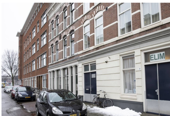
Het huidige Elim is gehuisvest in het pand tegenover dat van het oude Elim, aan de Tulpstraat in Rotterdam.