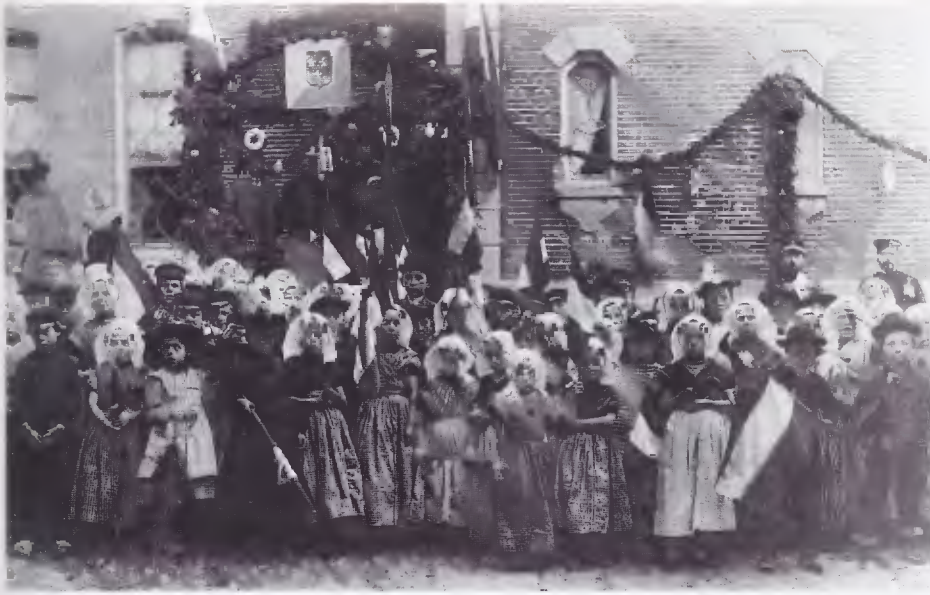
Linksboven: Voor het ambachtsherenhuis van Kloetinge staat in 1894 de dorpsjeugd klaar om de nieuwe ambachtsheer welkom te heten. Tot zo'n honderd jaar daarvoor werd het dorp ook door die heer bestuurd, nu had hij nog vooral een symbolische rol.